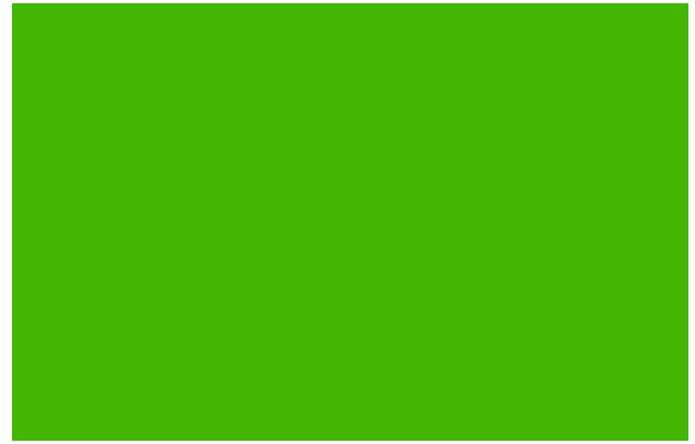
M3 Lage der innertropischen Konvergenzzone im Januar und Juli